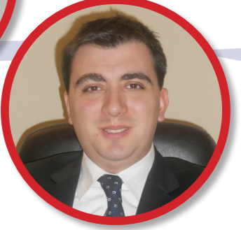
Av. Fırat Arkun

Tarih: 13 Mart 2012 Salı Saat: 13.30 - 17.00 Adres: Türkiye Kurumsal Yönetim Derneği Ofisi Yıldızposta Caddesi Dedeman İşhanı No: 48 Kat: 7 Esentepe Beşiktaş İstanbul Telefon: 0212 - 347 62 73