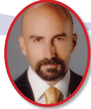
Av. Aydın Buğra İlder