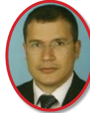
Av. Özgür Bülbül

Tarih: 05 Aralık 2012 Saat: 13:30 - 17:30 Adres: Avantgarde Hotel, Zincirlikuyu Telefon: 0212 347 62 73